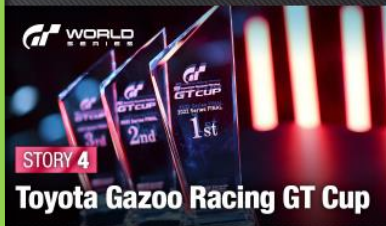
Story 4: the Toyota Gazoo Racing GT Cup: