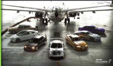
New Cars and a Track for the "Spec II" Update