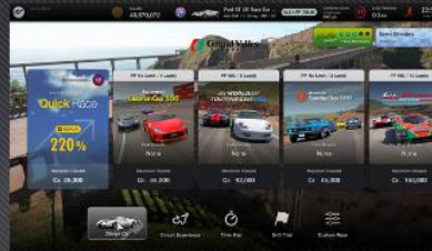
Dozens of New Features, and "World Circuits" is Now More Accessible and Fun to Play Than Ever!