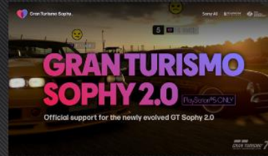
Gran Turismo Sophy 2.0 Now Available on Gran Turismo 7! A Dynamic Racing Experience for Players of All Levels