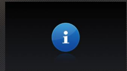
Known Issues [UPDATED: November 21st]