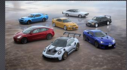
The Gran Turismo 7 Spec II Update: Seven New Cars, a New Track, and a Large Assortment of New Features!