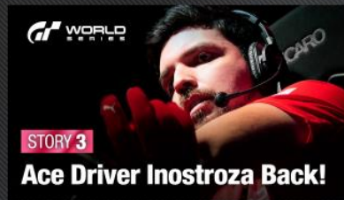
Story 3: Team Porsche Goes for Its First